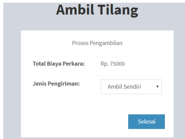
Gambar Jenis Pengiriman Ambil Sendiri

Setelah itu pilih jenis pengiriman, terdapat dua jenis pengiriman yaitu Ambil Sendiri dan Layanan Antar