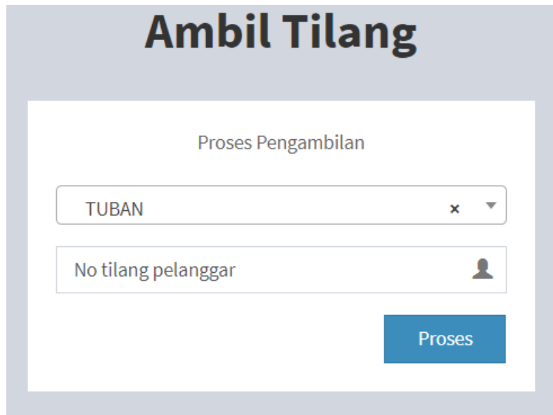
Gambar Input Kota Dan Nomor Tilang

Inputkan Kota dan Nomor Tilang sesuai dengan data yang anda miliki