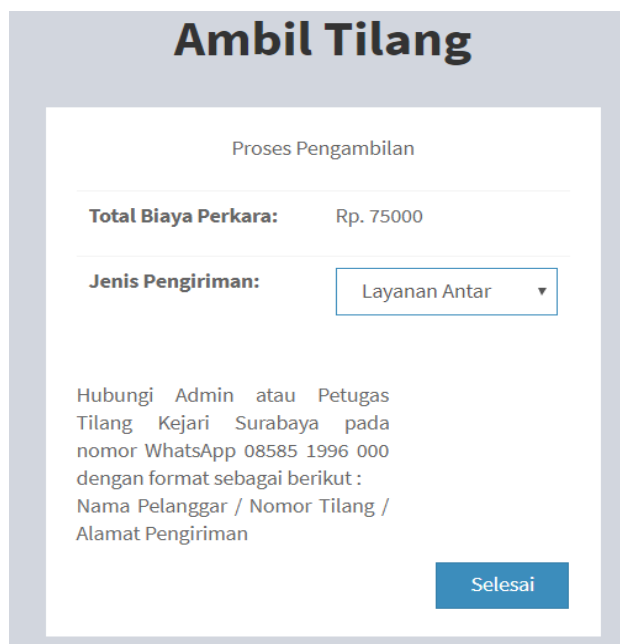
Gambar Jenis Pengiriman Layanan Antar